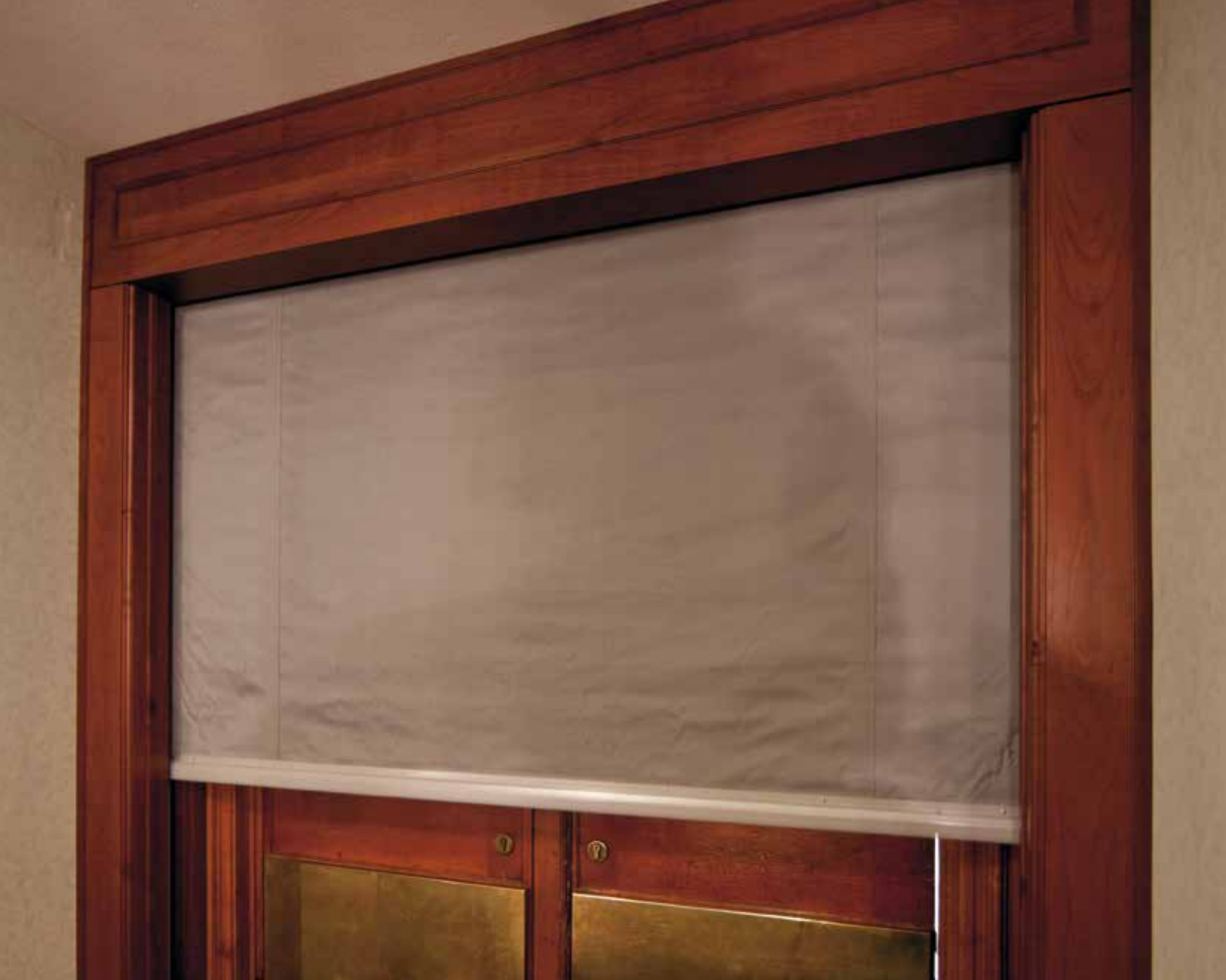
Hotel am Schloßgarten, Stuttgart